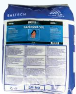
BAZÉNOVÁ SOL' na elektrolýzu slanej vody