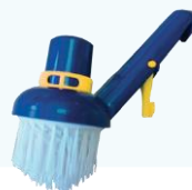
KEFA ROHOVÁ SACIA