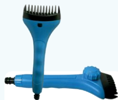
ČISTIČ papierových kartuší