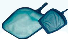
SIETKA HLADINOVÁ bez tyče