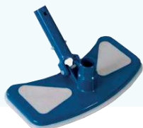
SACIA HUBICA ťažká