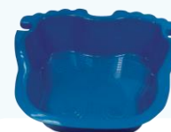
VANIČKA K BAZÉNU