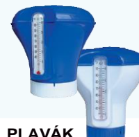
PLAVÁK S TEPLOMEROM na tablety mini a maxi