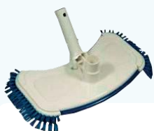
SACIA HUBICA Ťažká s bočnými kefami