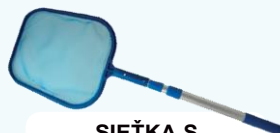
SIETKA S TELESKOPICKOU TYČOU