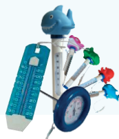
TEPLOMERY rôzne druhy