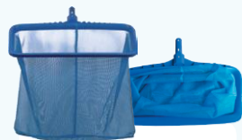
SIETKA NA DNO bez tyče