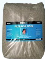
PIESOK DO FILTRÁCIE frakcia 0,755 - 1,25 mm